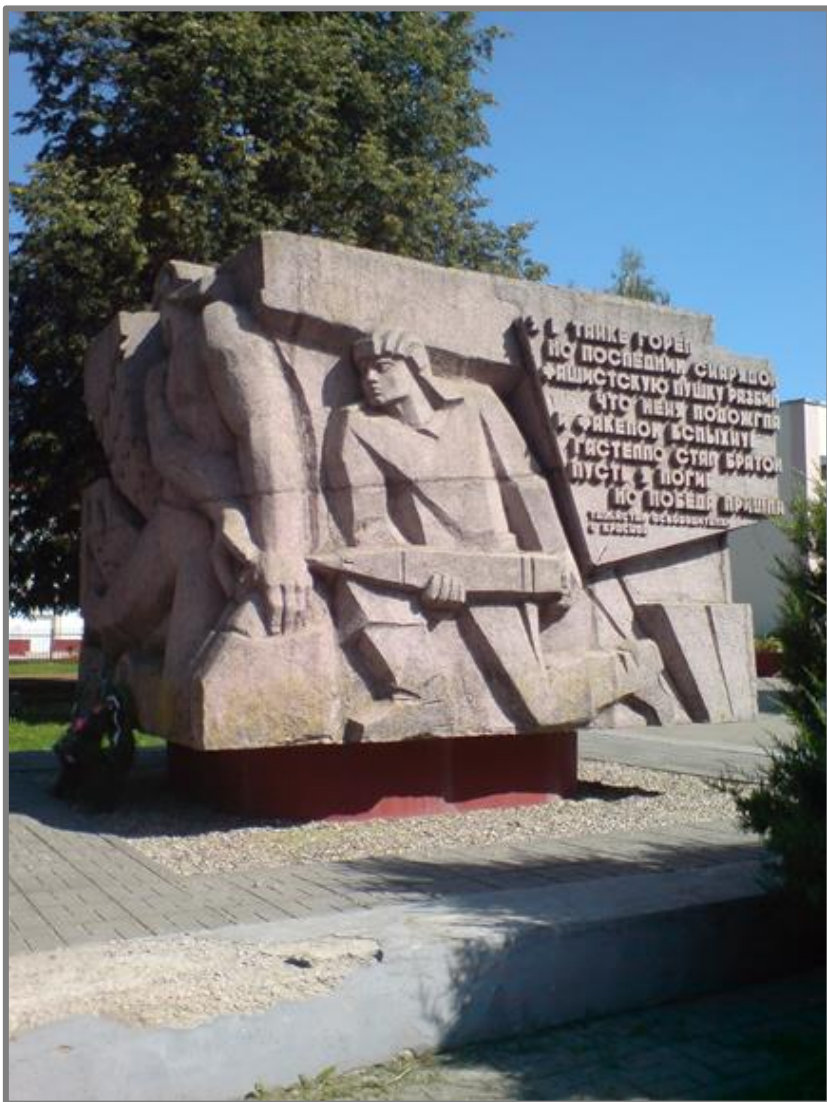
Фото 1. Памятник советским танкистам