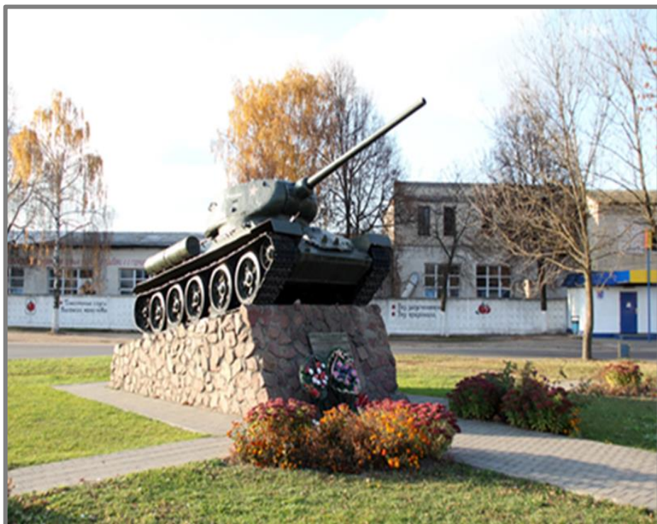
Фото 3. Памятник воинам-освободителям д. Красное