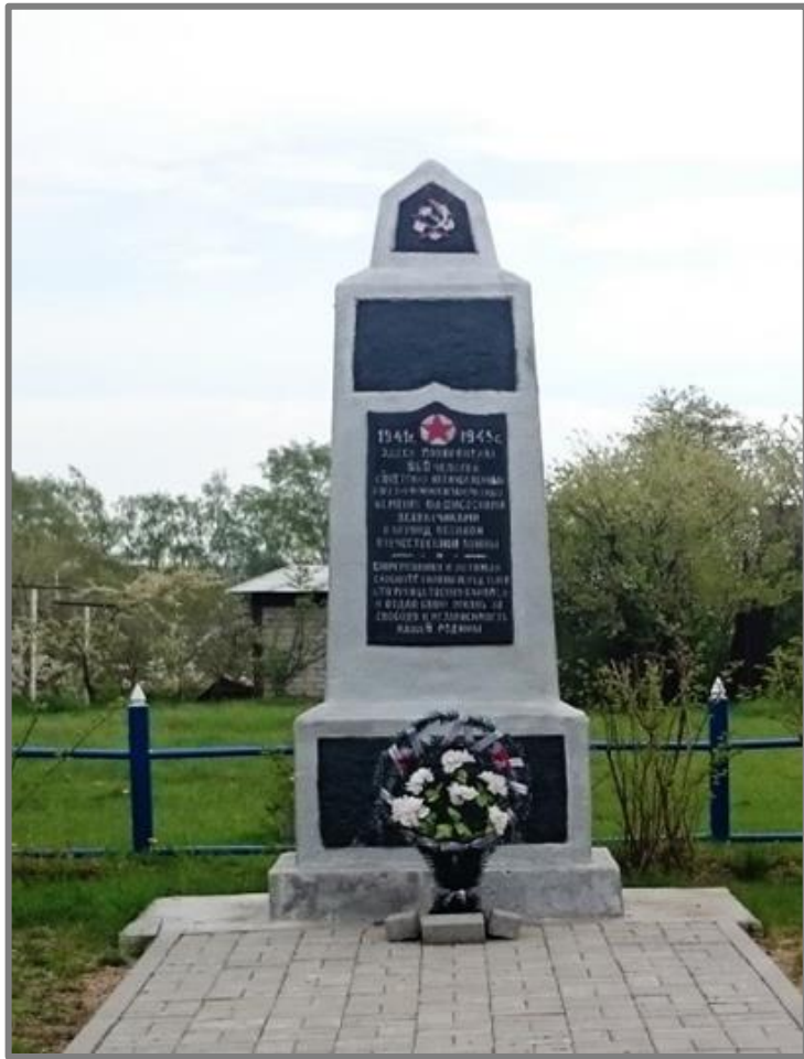
Фото 5. Памятник военнопленным. Братская могила