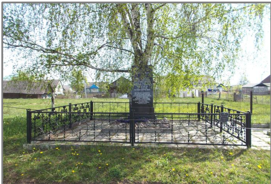
Фото 4. Памятник жертвам геноцида. Братская могила