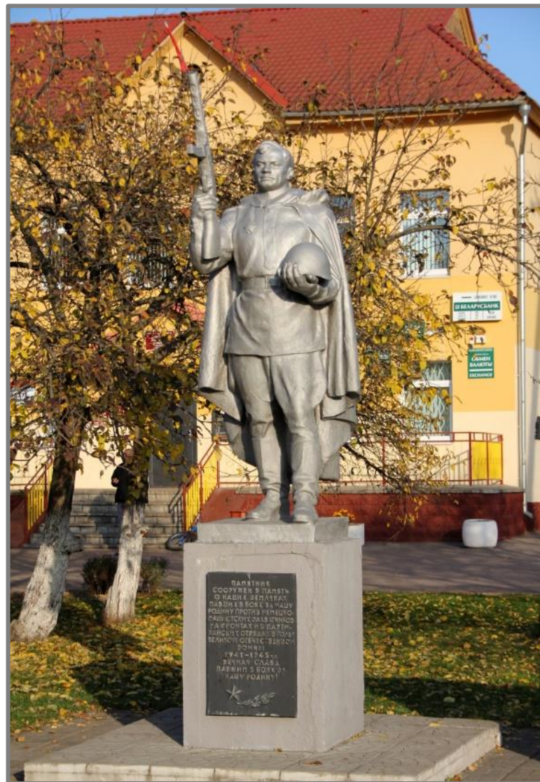
Фото 2. Памятник землякам